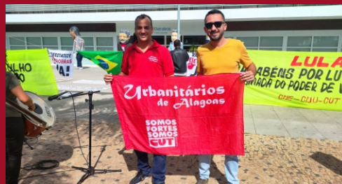
pela reestatização da Eletrobras.

Diante desse cenário preocupante, sindicatos, movimentos sociais e trabalhadores uniram-se neste ato conjunto, para reivindicar a reversão desse processo de privatização e lutar